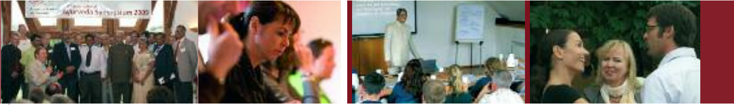
Beim 11. internationalen Ayurveda-Symposium 2009 waren die führenden Vertreter unserer Partner-Universitäten, über 30 internationale Referenten sowie befreundete Institutionen und Verbände aus 15 verschiedenen Ländern Europas, Indien und USA zu Gast in Birstein.